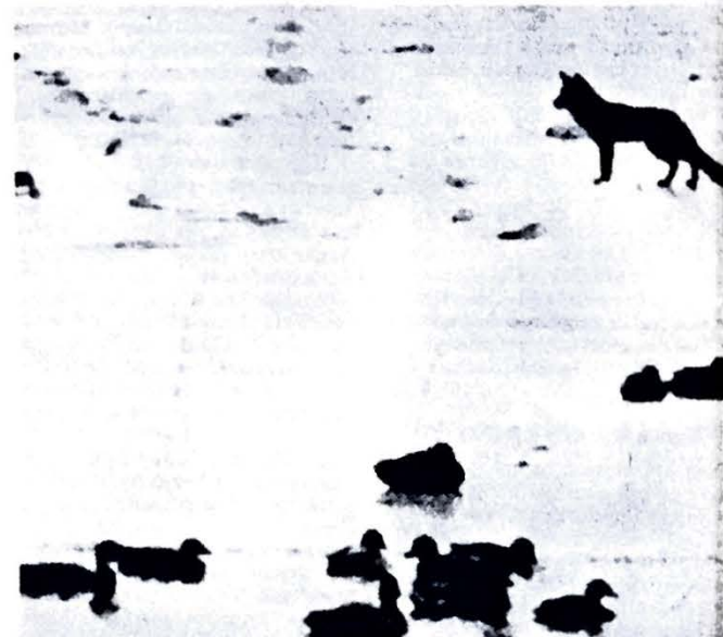
Rävarna kan nu obehindrat ta sig över till Ven på isen, men bara från danska sidan. De kan inte komma vidare till svenska fastlandet.